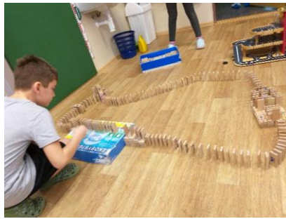
Pobyt v přírodě a hry