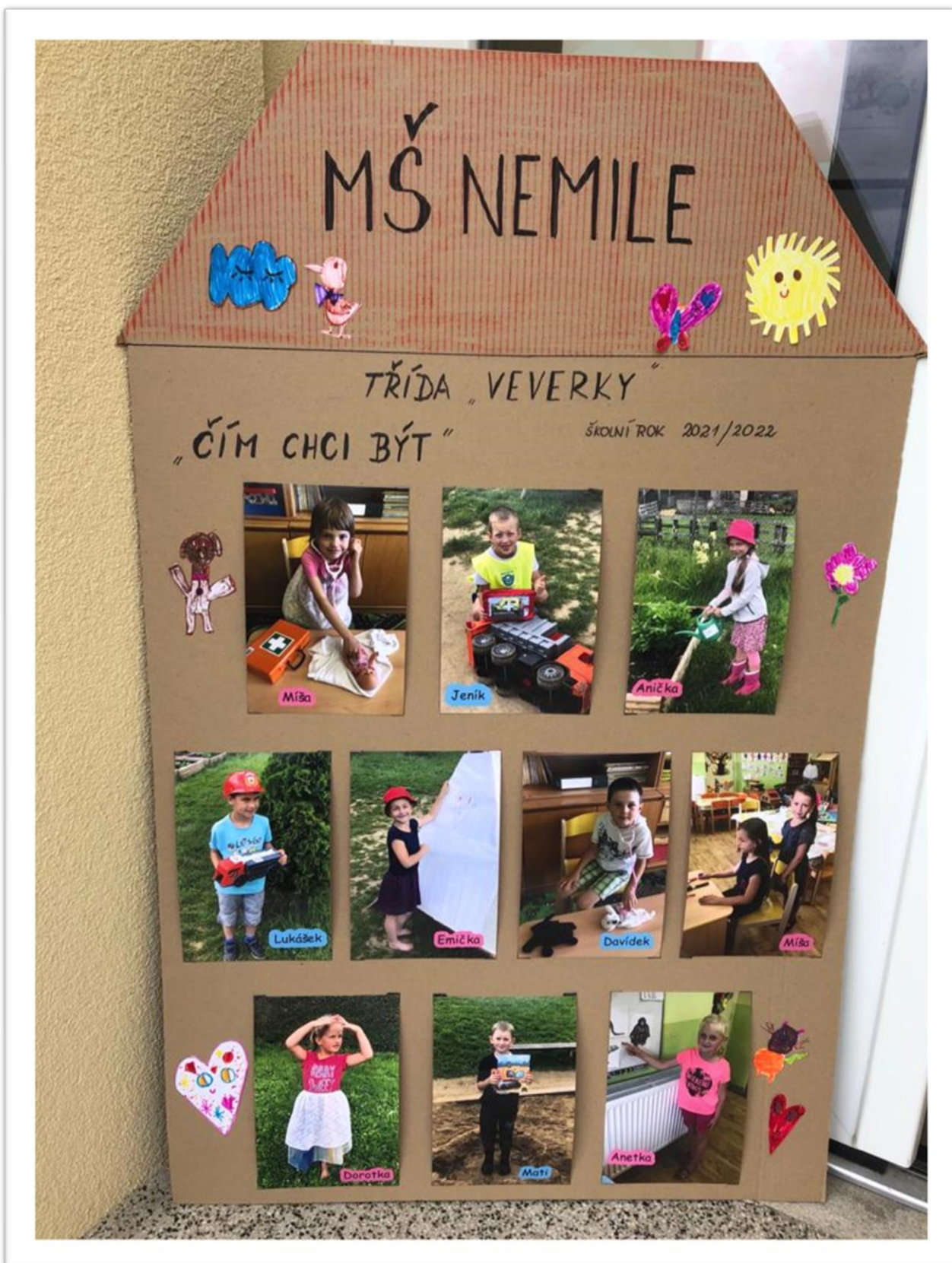
Fotogalerii graficky upravila PaedDr. Pavlína Neuwirthová.