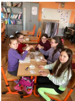
Malování kraslic v zájmovém útvaru Kreativ

Podklady pro bod ad 16) Školní družina zpracoval Marek Sobota