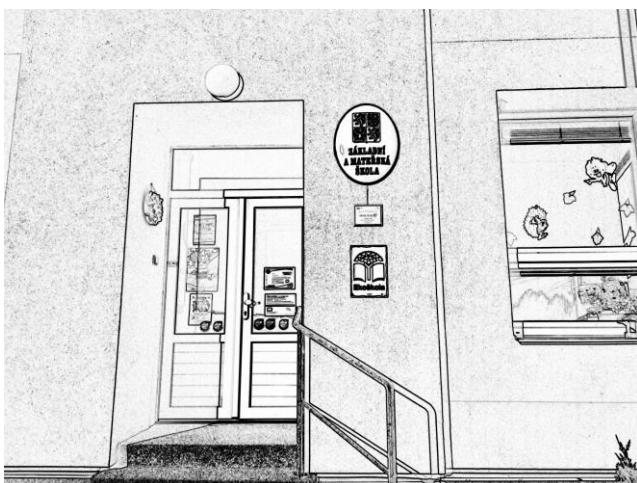
Vstupní dveře ZŠ a MŠ Nemile - ocenění Ekoškola a ocenění Etická škola